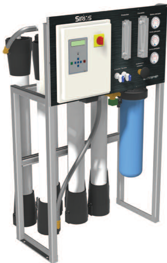
Charte des débits de production (litres/jour)